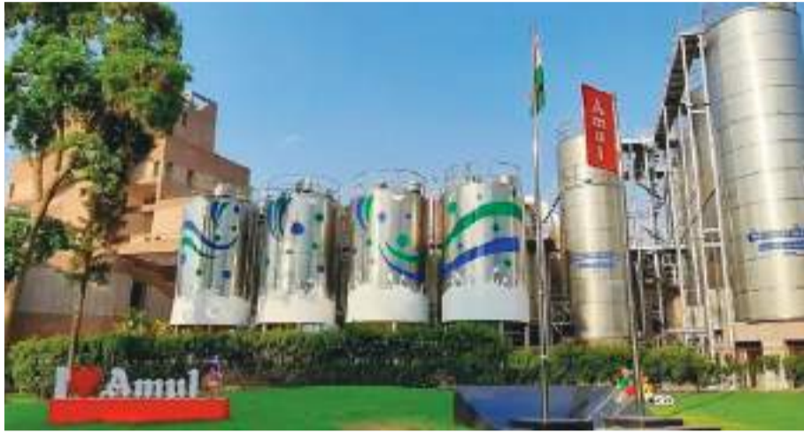
দুধ উৎপাদনে দেশে সর্বোচ্চ স্থানে আমূল। ১৯৪৬ সালে আনন্দ মিল্ক ইউনিয়ন লিমিটেড (AMUL) কোম্পানির হাত ধরে দেশের বড়

বড় শিল্পের খরা কাটতে চলেছে রাজ্যে। ৬০০ কোটির মেগা প্রকল্প হাওড়ায়। পশ্চিমবঙ্গে বিশ্বের বৃহত্তম দুই কারখানা তৈরি করতে চলেছে আমূল। বৃহৎ প্রকল্পের ফলে জেলায় প্রচুর কর্মসংস্থান হওয়ার সম্ভাবনা রয়েছে। প্রকল্পটি তৈরি হতে চলেছে হাওড়ার সাকরাইল ফুড পার্কে।