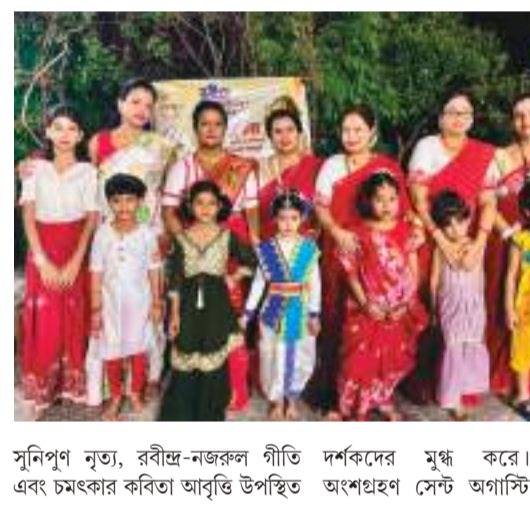
সুনিপুণ নৃত্য, রবীন্দ্র-নজরুল গীতি এবং চমৎকার কবিতা আবৃত্তি উপস্থিত