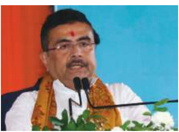
বোর্ড গঠনের সুযোগ দিয়েছিল। কিন্তু সংখ্যাগরিষ্ঠ দল সেই দায়িত্ব পালন করতে ব্যর্থ হওয়ায় সরকার বাধ্য হয়ে প্রশাসক নিয়োগ করেছে। শুভেন্দুর কথায়, '৮ জুন

নিজস্ব প্রতিবেদন: কলকাতা পুরসভার প্রশাসনিক ভবিষ্যৎ নিয়ে জল্পনার মাঝেই বড় ইঙ্গিত দিলেন মুখ্যমন্ত্রী শুভেন্দু অধিকারী। পুরভবনের মঞ্চ থেকে তিনি স্পষ্ট জানিয়ে দিলেন, প্রশাসক ব্যবস্থা স্থায়ী নয়। আগামী ছ'মাসের মধ্যেই কলকাতা পুরসভার দায়িত্ব নির্বাচিত বোর্ডের হাতে তুলে দেওয়াই সরকারের লক্ষ্য। ফলে চলতি বছরের ডিসেম্বরের মধ্যেই কলকাতা পুরভোটের সত্তাবনা উজ্জ্বল হয়ে উঠল বলে মনে করছে রাজনৈতিক মহল। সোমবার কলকাতা পুরসভায় 'স্বচ্ছতা সে স্বাগত' কর্মসূচির উদ্বোধন করতে গিয়ে মুখ্যমন্ত্রী বলেন, বিদায়ী মেয়রের পদত্যাগের পর আইনি নিয়ম মেনেই রাজ্য সরকার তিন দিনের মধ্যে নতুন