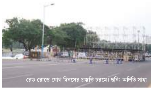
রেড রোডে যোগ দিবসের প্রস্তুতি চরমে।

গণতন্ত্রে শেষ কথা মানুষের হাতে। মুখ্যমন্ত্রীর এই বক্তব্য কার্যত কলকাতা পুরভোটের সম্ভাব্য সময়সীমা সামনে এনে দিল। রাজনৈতিক পর্যবেক্ষকদের মতে, পুরসভা প্রশাসনের উপর সরাসরি নিয়ন্ত্রণ প্রতিষ্ঠার পাশাপাশি দ্রুত নির্বাচনের আশ্বাস দিয়ে সরকার একদিকে গণতান্ত্রিক ভাবমূর্তি তুলে ধরতে চাইছে, অন্যদিকে পুর প্রশাসনের বর্তমান কাজকর্মের দায়ও নিজস্বের হাতে রাখতে চাইছে। কলকাতা পুরসভার গুরুত্ব তুলে ধরে মুখ্যমন্ত্রী বলেন, এই শহর শুধু কলকাতাবাসীর নয়, গোটা পূর্ব ভারতের অর্থনৈতিক ও প্রশাসনিক কেন্দ্র। প্রতিদিন লক্ষ লক্ষ মানুষের পরিষেবার সঙ্গে জড়িয়ে রয়েছে পুরসভার কাজ। পানীয় জল, নিকাশি, সাফাই, পার্ক রক্ষাবেক্ষণ, জমা-মুতার নথিভুক্তিকরণ, বিল্ডিং প্ল্যান অনুমোদন থেকে শুরু করে একাধিক পরিষেবা একদিনের জন্যও বন্ধ রাখা সম্ভব নয়। সেই কারণেই নির্বাচিত বোর্ড না থাকায় প্রশাসক নিয়োগের সিদ্ধান্ত নেওয়া হয়েছে বলে দাবি করেন তিনি। পাশাপাশি বিদায়ী কাউন্সিলর, জনপ্রতিনিধি এবং সাধারণ নাগরিকদের প্রশাসককে সহযোগিতার আবেদনও জানান। তবে মুখ্যমন্ত্রীর বক্তব্যে আরেকটি গুরুত্বপূর্ণ রাজনৈতিক বার্তাও স্পষ্ট। তিনি জানান, কলকাতার ওয়ার্ড পুনর্বিন্যাস বা ডিলিমিটেশন প্রক্রিয়া সম্পন্ন করে নির্বাচনের পথে এগোতে চায় সরকার। অর্থাৎ আগামী কয়েক মাসে পুরভোটের আগে ওয়ার্ডসীমা পুনর্নির্ধারণের কাজও শুরু হতে পারে।