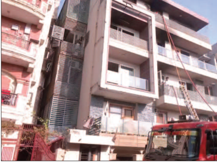
তিনি আরও লিখেছেন, 'স্থানীয় প্রশাসনের সমস্ত শীর্ষ আধিকারিক, দিল্লি দুর্ঘটনা

এই অগ্নিকাণ্ডের ঘটনায় শোকপ্রকাশ করেছেন দিল্লির মুখ্যমন্ত্রী রেখা গুপ্তা। তিনি সামাজিক মাধ্যমে লিখেছেন, 'বিবেক বিহারের একটি ভবনে অগ্নিকাণ্ডের ঘটনা অত্যন্ত মর্মান্তিক। এই দুর্ঘটনায় ৯ জনের মৃত্যু আমাকে গভীরভাবে মর্মান্বিত করেছে। আহতদের নিকটবর্তী হাসপাতালে চিকিৎসা চরছে এবং তাদের দ্রুত আরোগ্য কামনা করছি। এই শোকের মুহূর্তে ক্ষতিগ্রস্ত পরিবারগুলির প্রতি আমার সমবেদনা রইল। ঈশ্বরের কাছে প্রার্থনা করি, তিনি যেন তাঁদের এই কঠিন সময় মোকাবিলায় শক্তি দেন।'