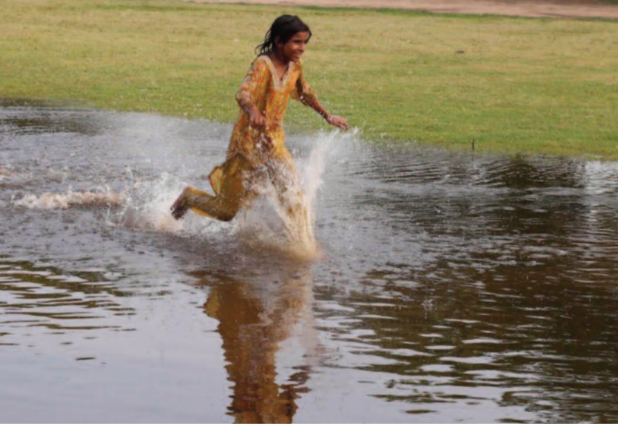
জল থইথই...।