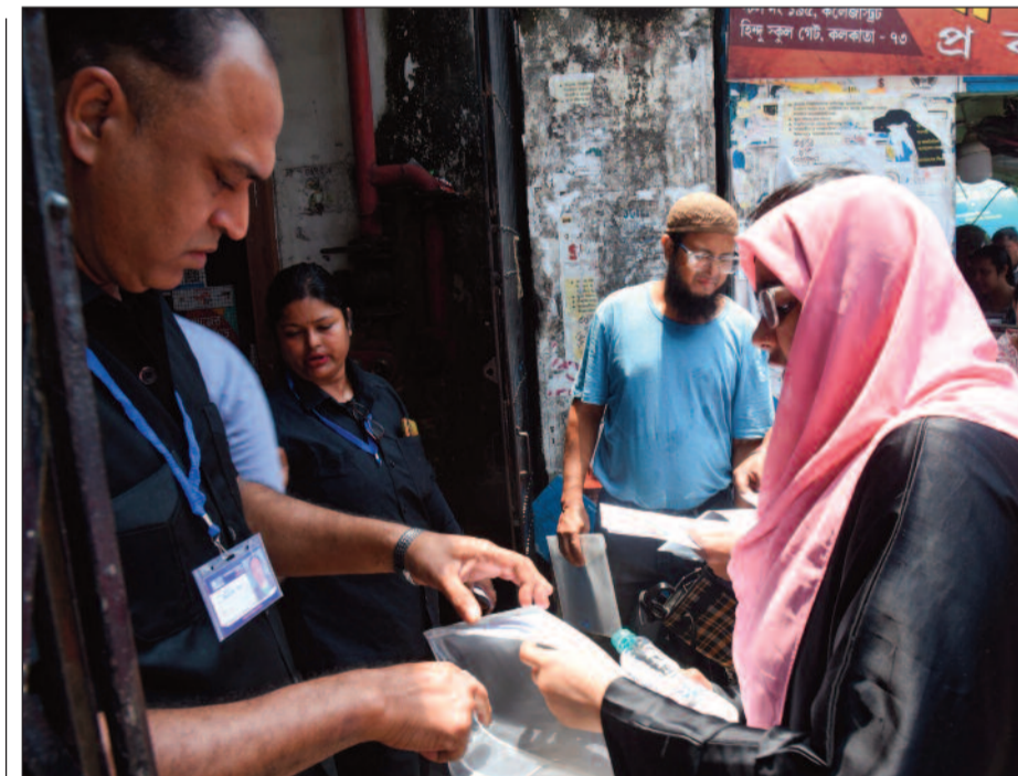
পরীক্ষাকেন্দ্রে প্রবেশের আগে নিট পরীক্ষার্থীদের তল্লাশি চলছে।

ঘটনাস্থলে উপস্থিত এক উত্তেজিত বিজেপি কর্মী ক্ষোভ উগরে দিয়ে বলেন, আমাদের বন্ধার জায়গায় গায়ের জোরে নিজেদের বাস্তব লাগিয়ে দেওয়া হয়েছে। গণতন্ত্রের বিরোধী শিবিরের ওপর এমন আক্রমণ কামা নয়, আমরা এর শেষ দেখতে ছাড়ব। অন্যদিকে, অভিযোগ অস্বীকার করে তৃণমূলের এক স্থানীয় নেতৃত্বের পালটা দাবি, এই অভিযোগ সম্পূর্ণ ভিত্তিহীন এবং সাজানো। মানুষের নজর ঘোরাতে ওরা নিজেরাই অশান্তি পাকানোর চেষ্টা করছে, আমাদের পতাকা সর্বত্র সমানোর সঙ্গেই ওড়ে।