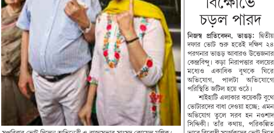
সপরিবারে ভোট দিলেন অভিনেত্রী ও রাজসভার সাংসদ কোয়েল মল্লিক।