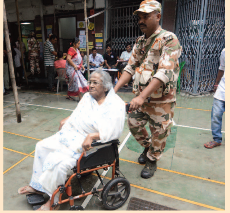
কেন্দ্রীয় বাহিনীর সাহায্যে হুইলচেয়ারে বসে ভোটকেন্দ্রে পৌঁছলেন দিলেন বৃদ্ধা।