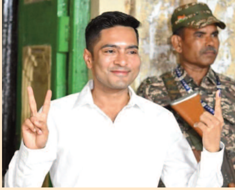
মিত্র ইনস্টিটিউটে ভোট দিলেন তৃণমূলের সেকেন্ড ইন কমান্ড অভিষেক বন্দ্যোপাধ্যায়।