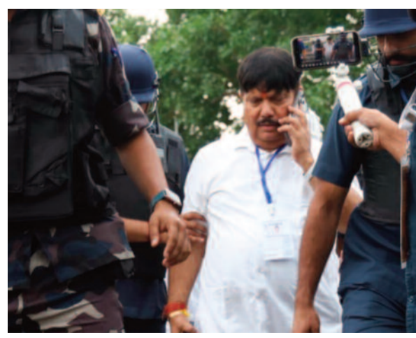
ধরেন অর্জুন। পরিস্থিতি নিয়ন্ত্রণে আনতে কেন্দ্রীয় বাহিনী সক্রিয় হয়। অর্জুন সিংয়ের কথায়, গণতন্ত্রের নামে প্রহসন চলতে দেওয়া যায় না, আমরা হাতেনাতে ধরেছি। অন্যদিকে, দিনভর এলাকায় ঘুরে সাধারণ মানুষের সঙ্গে তাঁর যোগাযোগ ও সমর্থনও স্পষ্ট হয়েছে। অর্জুন সিংকে দেখা গেছে

নোয়াপাড়ায় বিজেপি নেতা অর্জুন সিংয়ের সক্রিয়তা ছিল চোখে পড়ার মতো। সকালেই নিজের ভোট দিয়ে এলাকায় টহল শুরু করেন। অলি-গলি ঘুরে প্রতিটি বুথে নজরদারি চালান তিনি। কোথাও অনিয়মের খবর পেলেই সময় নষ্ট না করে ঘটনাস্থলে পৌঁছে যান। কখনও রেললাইন টপকে, কখনও দ্রুত কনভয় ছেড়ে হেঁটে। উত্তর ব্যারাকপুর পুরসভার ১৩ নম্বর ওয়ার্ডের একটি বুথে ছাড়া ভোটের অভিযোগ পেয়ে সশরীরে পৌঁছে উত্তেজনার মধ্যে পড়েন তিনি। অভিযোগ, তৃণমূলের এক কাউন্সিলর ও তাঁর অনুগামীরা বুথের ভিতরে ভোটারদের প্রভাবিত করছিলেন। হাতেনাতে গিয়েই