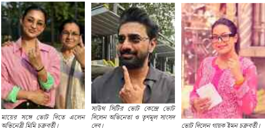
মায়ের সঙ্গে ভোট দিতে এলেন অভিনেত্রী মিমি চক্রবর্তী।