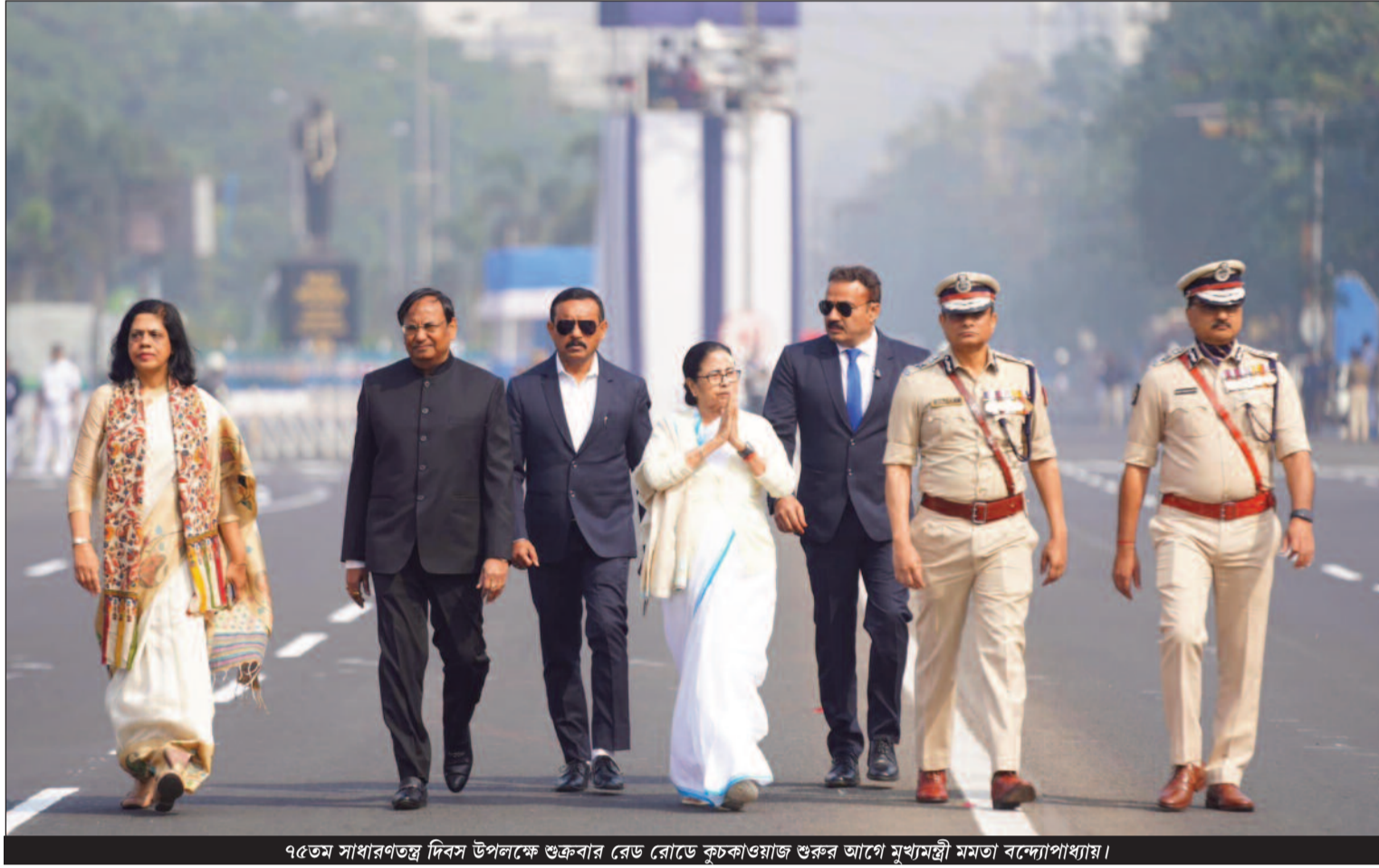
৭৫তম সাধারণতন্ত্র দিবস উপলক্ষে শুক্রবার রোড রোডে কৃষ্ণাওয়ার সুরুর আগে মুখ্যমন্ত্রী মমতা বন্দ্যোপাধ্যায়।

কলকাতা ২৮ জানুয়ারি ২০২৪ ১৩ মাঘ ১৪৩০ রবিবার সপ্তদশ বর্ষ ২২৬ সংখ্যা ৮ পাতা ৩.০০ টাকা ■ Kolkata, 28.1.2024, Vol.17, Issue No. 226, 8 Pages, Price 3.00