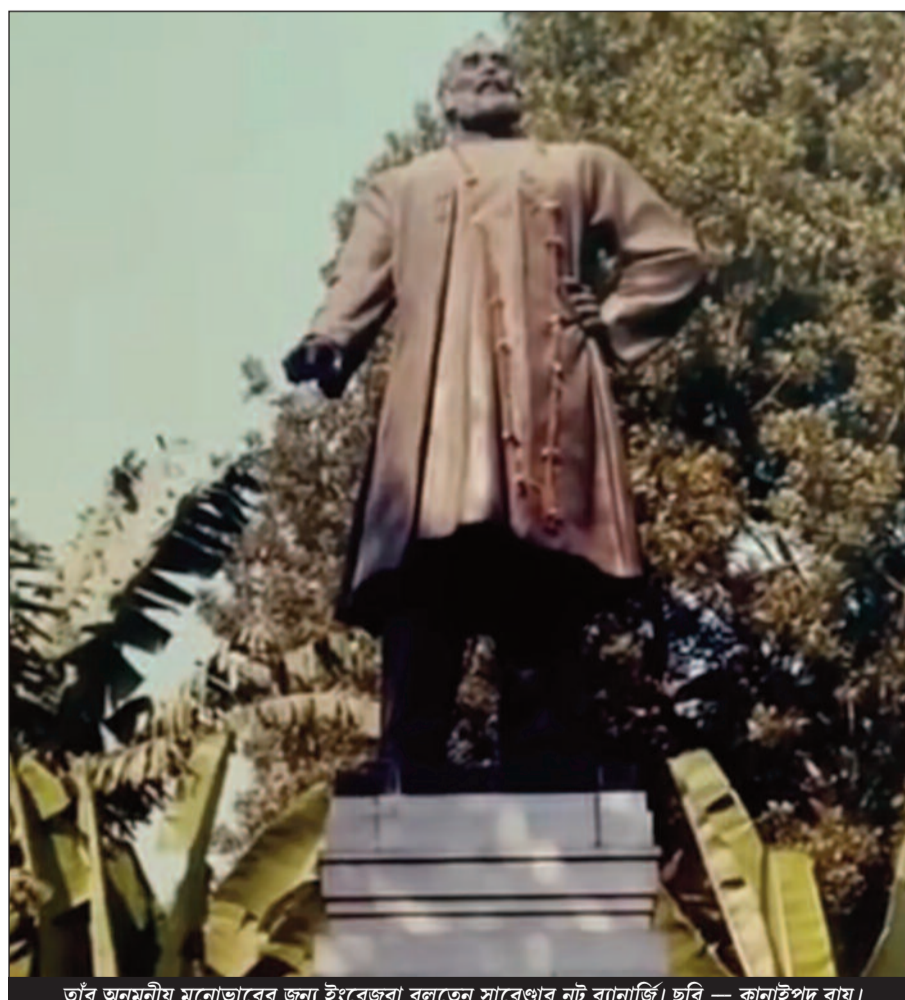
তাঁর অনন্য মনোভাবের জন্য ইংরেজরা বলতেন সারেগার নট বানার্জি।

‘সুরেন্দ্রনাথের বাসভবন’ লেখা পাঠের ফলক বসাই। এর পর থেকে বাড়িটি হেরিটেজ ঘোষণার চেষ্টা করতে থাকি। সেই চেষ্টা সফল হয় ২০০৭-এর ৫ মার্চ।