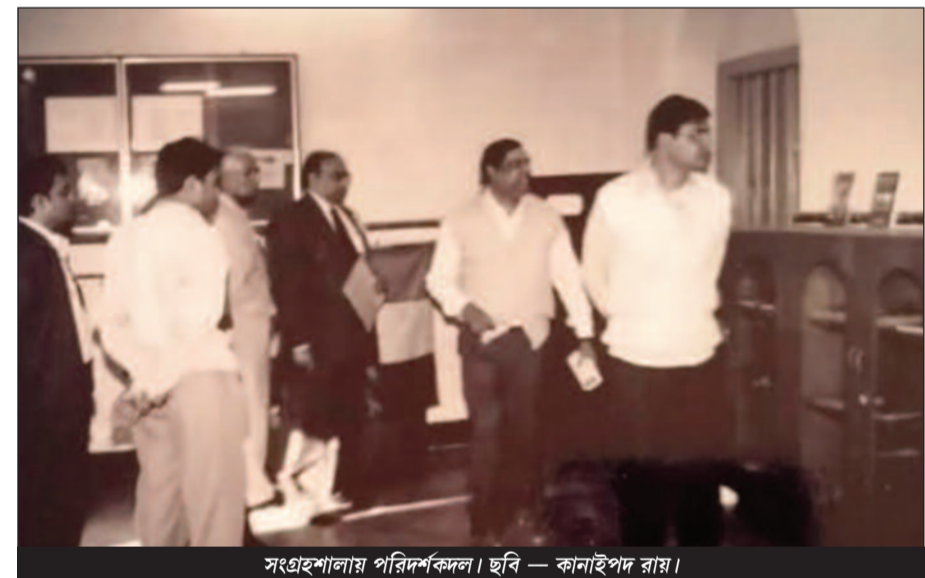
সংগ্রহশালায় পরিদর্শক।