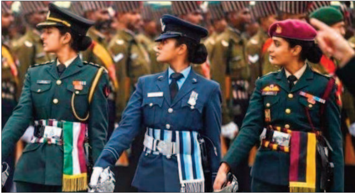
৭৫তম সাধারণতন্ত্র দিবসে দিল্লির কর্তব্যপথে ভারতীয় সেনায় নারীশক্তির ক্ষমতায়নের প্রদর্শন।