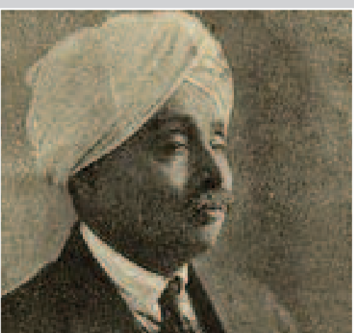
লালা লাজপত রায়

১৮৬৫ বিশিষ্ট রাজনীতিবিদ লাল লাজপত রায়ের জন্মদিন। ১৯৩০ বিশিষ্ট উচ্চাঙ্গ সঙ্গীতশিল্পী পণ্ডিত যশরাজের জন্মদিন। ১৯৩৭ বিশিষ্ট সঙ্গীতশিল্পী সুমন কল্যানপুরের জন্মদিন।