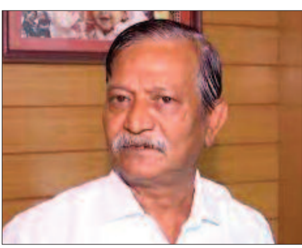
পাশাপাশি এমনটাও শোনা যাচ্ছে, নির্দেশ পরিমার্জনের আদালতের দ্বারস্থ হতে পারে ইডি। কালীঘাটের কাকুর কঠোর নমুনা পরীক্ষাকে কেন্দ্র করে জটিলতা চলছেই। প্রথমে

নিজস্ব প্রতিবেদন, কলকাতা: এসএসকেএমের বিরুদ্ধে গড়িমসির অভিযোগ উঠেছিল। সৃজনকৃষ্ণ উদ্বার কঠোর সংগ্রহ করার সিদ্ধান্ত নিতে এরপর আদালত দায়িত্ব দিয়েছিল ইএসআই জোকাতে। মেডিক্যাল বোর্ড গড়ে এ ব্যাপারে সিদ্ধান্ত নিতে নির্দেশ দিয়েছিল আদালত। তবে এক সপ্তাহ পেরিয়ে গেলেও নিয়োগ দুর্নীতিতে ধৃত সৃজনকৃষ্ণ উদ্বার কঠোর নমুনা সংগ্রহ করা কঠোর কঠোর নমুনা সংগ্রহ করা সম্ভব হল না। কোর্টের নির্দেশ পালনে ব্যর্থ ইএসআই জোকা, কারণ, চিকিৎসক সঙ্কটে মেডিক্যাল বোর্ড গঠনই করে উঠতে পারছে না এই কেন্দ্রীয় প্রতিষ্ঠান, এমনটাই খবর। জানা গিয়েছে, এই মুহূর্তে ইএসআই জোকায় নিউরোলজির চিকিৎসক নেই। এ বিষয়ে তাঁরা ইডিকে জানিয়ে দিয়েছে বলেও খবর।