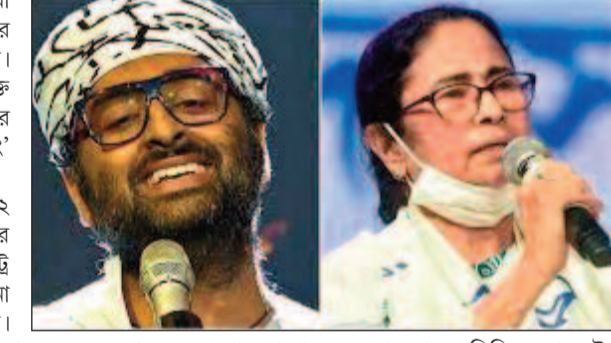
মদলবর নেতাজি ইনডোর স্টেডিয়ামে হবে উদ্বোধনী অনুষ্ঠান। উদ্বোধনী অনুষ্ঠানে চাঁদের হাট বসলেও, থাকছেন না শাহরুখ খান। ব্যস্ততার কারণে তিনি যে থাকতে পারবেন না তা আগেই জানিয়ে দিয়েছিলেন। কলকাতা চলচ্চিত্র উৎসবের

নিজস্ব প্রতিবেদন, কলকাতা: আগামী ৫ ডিসেম্বর থেকে শুরু হচ্ছে এবারের কলকাতা আন্তর্জাতিক চলচ্চিত্র উৎসব। শনিবার সেই উৎসবের থিম সং মুক্তি পেল। মুখ্যমন্ত্রী মমতা বন্দ্যোপাধ্যায়ের ভাবনায় বানানো এবারের 'থিম সং' গেয়েছেন অরিজিৎ সিং। চলচ্চিত্র উৎসব চলবে ১২ ডিসেম্বর পর্যন্ত চলবে। এবারের চলচ্চিত্র উৎসবের ফোকাস কান্দি স্পেন। এই উৎসবে এবার দেখানো হবে ৩৯টি দেশের ২১৯ টি ছবি।