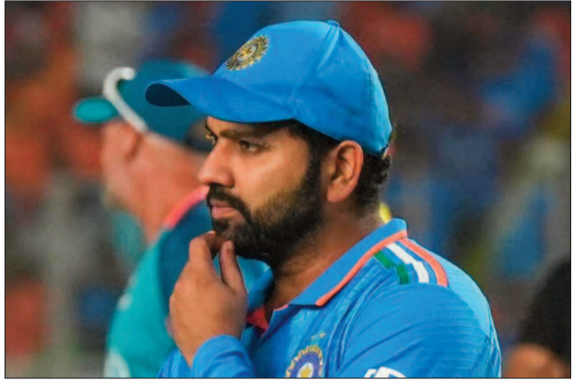
নিজস্ব প্রতিবেদন: ভারত বিশ্বকাপ জিতবে, এমনটাই বাজি ধরেছিলেন ইংল্যান্ডের প্রাক্তন অধিনায়ক কেভিন পিটারসেন। কিন্তু ফাইনালে ভারত অস্ট্রেলিয়ার কাছে হেরে যাওয়ায় বাজি হেরে গিয়েছেন তিনি। ভারতে কোভিড লিগ ক্রিকেট খেলতে এসে পিটারসেন বলেন, “আমার বাজি ছিল ভারত। ওরা যে ভাবে গৌটা প্রতিযোগিতায় খেলছিল তাতে ফাইনাল জিতবে

ভেবেছিলাম। কিন্তু ফাইনালে অস্ট্রেলিয়ার মতো দলের বিরুদ্ধে ফাইনাল সহজ নয়। ওরা খুব কঠিন প্রতিপক্ষ। ফাইনালে ভারত হেরে গেল। সেই সঙ্গে আমিও বাজি হেরে গেলাম।” শুধু ভারতের হার নয়, গৌটা প্রতিযোগিতায় ইংল্যান্ডের খেলা নিয়েও হতাশ পিটারসেন। তিনি বলেন, “ইংল্যান্ড খুব খারাপ খেলেছে। কেউ আশা করেনি যে ওরা ফাইনালে উঠবে। এত খারাপ ইংল্যান্ডকে আমি কোনও দিন খেলতে দেখিনি। ওরা বুঝতেই পারছিল না কী করবে। কোনও পরিকল্পনা ছিল না।” দেশের মাটিতে বিশ্বকাপে গৌটা রাউন্ড রবিন পর্বে ভাল খেলেছিল ভারত। প্রথম ম্যাচেই অস্ট্রেলিয়াকে হারিয়েছিল ভারত। তার পর টানা আট ম্যাচ জিতে সেমিফাইনালে উঠেছিলেন রোহিত শর্মারা। সেমিফাইনালে নিউ জিল্যান্ডের বিরুদ্ধেও বড় জয় পায় ভারত। সেই কারণে ফাইনালে ভারতকে জেতার বড় দাবিদার মনে করেছিল সবাই। কিন্তু ফাইনালে অস্ট্রেলিয়ার কাছে হারতে হয় রোহিতদের। আরও এক বার শেষ ম্যাচে শেষ হয়ে যায় ভারতের বিশ্বকাপ জয়ের স্বপ্ন।