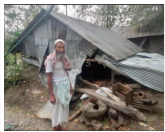
ব্যাপক ক্ষতি ফসলের

ঢাকা, ১৮ নভেম্বর: বঙ্গোপসাগরে তৈরি হওয়া ঘূর্ণিঝড় 'মিথিলি' গতিপথ বদলে আছড়ে পড়েছে বাংলাদেশে। ঘূর্ণিঝড়ের প্রভাবে ভারী বৃষ্টিপাত হয়েছে সেদেশের উপকূলবর্তী বিভিন্ন জেলায়। ক্ষতিগ্রস্ত হয়েছে বহু কাঁচা ঘরবাড়ি। ঝড়ের কবলে মৃত্যু হয়েছে ৮ জনের। ব্যাপক ক্ষতি হয়েছে ফসলেরও।