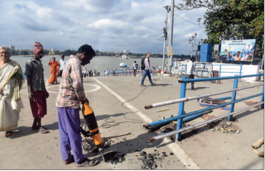
বাজে কলমতলা ঘাটে চলছে ছটপুজার প্রস্তুতি।