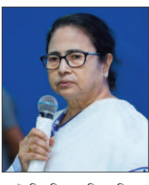
রাজনৈতিক হিংসার বলি হয়েছিলেন। ৮ জুলাই পঞ্চায়েত নির্বাচনী হিংসায় নিহতদের পরিবারদের আর্থিক সাহায্য দেওয়ার পাশাপাশি চাকরি দেওয়ার কথা ঘোষণা করেছিলেন মুখ্যমন্ত্রী মমতা বন্দ্যোপাধ্যায়। গত ১২ জুলাই নবামে সাংবাদিক বৈঠক করে একথা জানান তিনি। সেসময় মুখ্যমন্ত্রী জানিয়েছিলেন, 'নিহতদের পরিবারকে আমরা দুই লাখ টাকা করে দেব। হোমগার্ডের চাকরি দেওয়া হবে।'

উল্লেখ্য, গত পঞ্চায়েত নির্বাচনে রাজ্যের বিভিন্ন প্রান্তে ১৯ জন