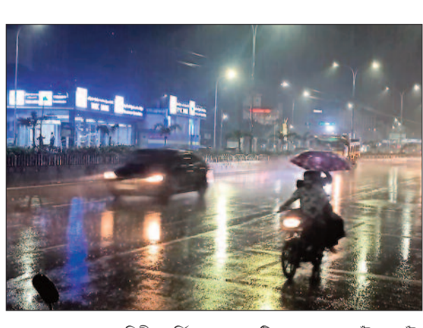
বঙ্গোপসাগরের বুকে দ্বিতীয় ঘূর্ণিঝড় 'মিথিলি'। এর আগেও ঘূর্ণিঝড়ের প্রভাবে একাধিক বার তরুলহ হয়েছে বাংলাদেশের উপকূলবর্তী জেলাগুলির বিস্তীর্ণ এলাকা। তাই 'মিথিলি' থেকে আসার খবর পাওয়ার পর থেকেই আশঙ্কায় ছিল খেপুপাড়া এবং তৎসংলগ্ন এলাকার বাসিন্দারা। তবে হাওয়া অফিস সূত্রে খবর, 'শক্তি' কম হওয়ার কারণে বাংলাদেশ উপকূলে আছড়ে পড়লেও বিশেষ ক্ষয়ক্ষতির সম্ভাবনা নেই।

নিজস্ব প্রতিবেদন: বাংলাদেশ উপকূলে আছড়ে পড়ল 'মিথিলি'। শুক্রবার বিকালে সাড়ে ৪টা নাগাদ বাংলাদেশের খেপুপাড়া উপকূলে ৮৫ কিলোমিটার বেগে আছড়ে পড়েছে উত্তর-পশ্চিম বঙ্গোপসাগরের তৈরি হওয়া এই ঘূর্ণিঝড়। হাওরা অফিস জানিয়েছে, গত ছ'ঘণ্টায় উত্তর-পশ্চিম এবং তৎসংলগ্ন উত্তর-পূর্ব বঙ্গোপসাগরে থাকা ঘূর্ণিঝড় ২৫ কিলোমিটার বেগে আরও উত্তর-উত্তরপূর্ব দিকে অগ্রসর হয়েছিল। দুপুর আড়াইটা নাগাদ খেপুপাড়া থেকে ৩০ কিলোমিটার দক্ষিণ-দক্ষিণপশ্চিমে এবং চট্টগ্রাম থেকে ২৫০ কিলোমিটার দক্ষিণ-পশ্চিমে অবস্থান করছিল 'মিথিলি'। এর পর তা আরও উত্তর-উত্তরপূর্ব দিকে এগিয়ে এসে শুক্রবার বিকালে খেপুপাড়া উপকূলে আছড়ে পড়ে।