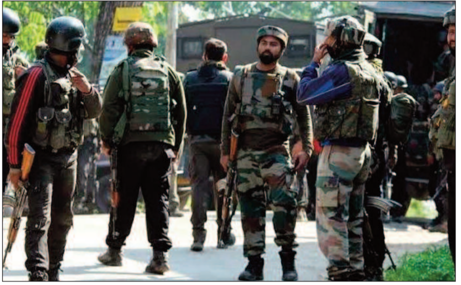
পরিচিত। হাজি পোরার অদূরে ওয়াইকে পোরা এলাকায় ২০২০ সালের অক্টোবর বিজেপি যুব লক্ষ্যের ঘনিষ্ঠ জঙ্গি সংগঠন 'দ্য রেজিস্টার্ড ফ্রন্ট' (টিআরএফ)।

শ্রীনিগর, ১৭ নভেম্বর: সেনা, সিআরপিএফ এবং পুলিশের যৌথ অভিযানে গুজরাটের ভোজ জম্মু ও কাশ্মীরের কুলগাম জেলায় পাক সন্ত্রাসবাদী সংগঠন লক্ষার-ই-তইবার তিন জঙ্গি নিহত হয়েছে।