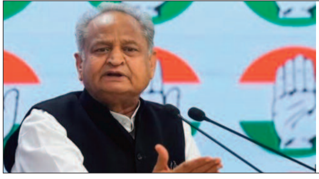
গোলটের এমএন মন্তব্যে কংগ্রেস শিবিরে টানা পোড়েন আরও বাড়তে পারে। গোলটের বক্তব্য, মুখ্যমন্ত্রীর কুর্সি তাকে ডাকছে। অর্থাৎ কংগ্রেস ক্ষমতায় ফিরলে ওই কুর্সির দাবিদার তিনিই। মুখ্যমন্ত্রীর পদ নিয়েই