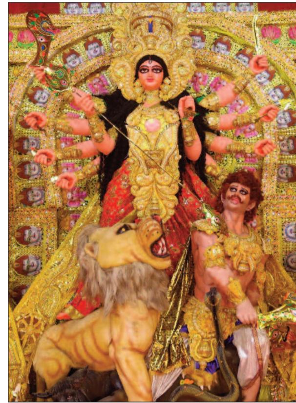
নিউটাউন সর্বজনীন দুর্গাপ্রতিমা (বাম দিকে), বাগবাজার সর্বজনীন স্বমহিমায় উজ্জ্বল মায়ের মুখ (মাঝে), গড়িয়া শ্রীরামপুর কলাপ সমিতির মূর্তি।