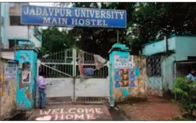
যাদবপুর বিশ্ববিদ্যালয়ের আবাসিকদের জন্য কঠোর হল নিয়মকানুন।

নিজস্ব প্রতিবেদন, যাদবপুর: এবার যাদবপুর বিশ্ববিদ্যালয়ে কড়া পদক্ষেপ আবাসিকদের জন্য। কোনও ভাবেই রাত ১০টার পর হস্টেলের বাইরে থাকা যাবে না তাঁদের। প্রসঙ্গত, যাদবপুরের প্রথম বছরের ছাত্রমৃত্যুর ঘটনায় আগেই অ্যান্টি র্যাগিং কমিটি পুনর্গঠন করা হয়েছিল। এবার ৫৫ সদস্যের অ্যান্টি র্যাগিং স্কোয়াড গড়ল যাদবপুর বিশ্ববিদ্যালয় কর্তৃপক্ষ। এদিকে ক্যাম্পাস ও হস্টেলগুলি সব গেটে সিসিটিভি বসানোর কাজ শুরু হয়েছে মঙ্গলবার থেকেই।