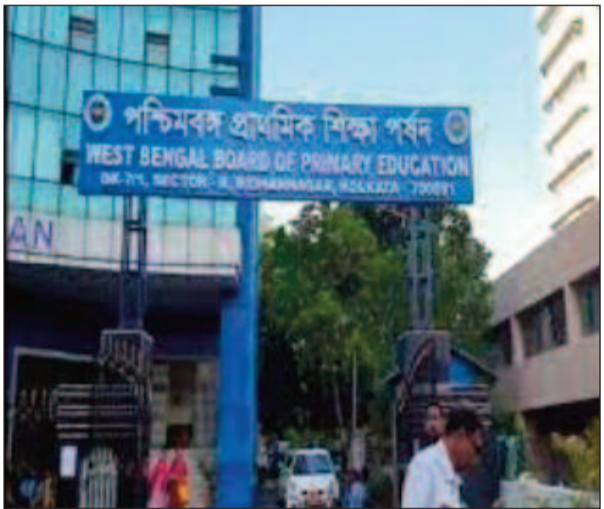
কলকাতা: টেট-এ ফেল করেও প্রাথমিকে চাকরি পেয়েছিল আরও ৯৬ জন।

এদিকে বৃহস্পতিবার আদালত নির্দেশ দেয়, প্রাথমিক নিয়োগ দুর্নীতির তদন্তে সিবিআই এবং ইন্ডির অফিসাররা এবার পর্যদের অফিসে যাবেন। অর্থাৎ এবার কেন্দ্রীয় জোড়া ফলার আক্রমণের মুখে পড়তে চলেছে পর্ষদ। তদন্তে নেমে দুই কেন্দ্রীয় তদন্তকারী সংস্থার আধিকারিকরা এবার