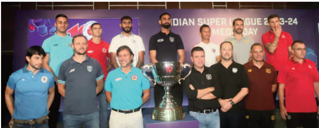
বুধবার আইটিসি সোনার বাংলায় ইন্ডিয়া সুপার লিগ মিডিয়া ডে-তে উপস্থিত ছিলেন মোহনবাগান, ইস্টবেঙ্গল, জামশেদপুর এফসি, নর্থ ইস্ট ইন্ডাইটেড এফসি, ওড়িশা এফসি, পাঞ্জাব এফসি এবং কেরালা ব্লাস্টার্সের কোচ এবং অধিনায়করা।

কলকাতা: ২১ তারিখ থেকে শুরু আইএসএল। দশম আইএসএল ঘিরে উদ্‌যাদনার পারদ এখন থেকেই চড়তে শুরু করে দিয়েছে। এ বারের লিগে দলের সংখ্যা বেড়েছে। এ বার আইএসএলে খেলবে ১২টি দল। আইএসএলের দশম সংস্করণ শুরুর