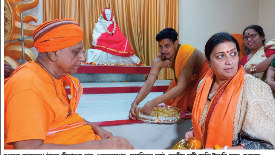
বুধবার ডানলপে ঠাকুর সীতারাম দাস ওকারনাথের মহামিলন মাঠে কেন্দ্রীয় মন্ত্রী স্মৃতি ইরানি ঘুরে গেলেন।