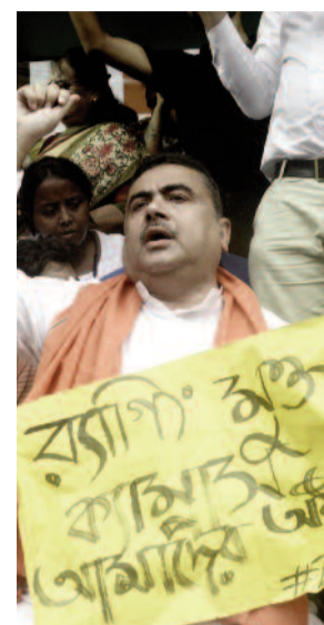
যাদবপুর ক্যাম্পাসে শুভেন্দু অধিকারী।

নিজস্ব প্রতিবেদন, কলকাতা: যাদবপুর বিশ্ববিদ্যালয়ের এক প্রতিবাদ কর্মসূচিতে বিরোধী দলনেতা শুভেন্দু অধিকারী আক্রান্ত হওয়ার অভিযোগ তুলেছিলেন। সেই অভিযোগের প্রেক্ষিতে শুভেন্দুর কাছ থেকে বিস্তারিত জানতে নাটস পাঠাল পুলিশ। প্রসঙ্গত, যাদবপুরের পড়ুয়া মৃত্যুর পর বিশ্ববিদ্যালয়ের ক্যাম্পাসের কাছে একটি প্রতিবাদ সভার আয়োজন করা হয় বিজেপির তরফে। এটিতে কমান্ডের একটি প্রতিবাদ সভায় যোগ দিয়েছিলেন বিরোধী দলনেতা শুভেন্দু অধিকারী। সেখানেই অপর এক ছাত্র সংগঠনের বিরোধ বাধে। যাদবপুর বিশ্ববিদ্যালয়ের ৩ নম্বর গেটের সামনে শুরু হয় তুলুল হই হই গোল। শুরু হয় হাতাহাতিও। এই সময়েই শুভেন্দু অধিকারীর উপর কয়েকজন ছাত্র চড়াও হয় বলে অভিযোগ করা হয়। শুভেন্দু অধিকারীকে শারীরিক নিগ্রহ করা হয় বলেও অভিযোগ। অতি বামপন্থী দলের সদস্যরা তাঁর উপর আক্রমণ চালিয়েছে বলে