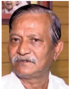
সেগুলো অধিকাংশই শেল কোম্পানির মতো কাজ করে। ঘুরপথে কাল টাকা চুকেছে ইঙ্গিত গোয়েন্দাদের প্রকাশ্যে আসছে একাধিক নির্মাণ সংস্থা নাম 'লিপ্স অ্যান্ড বাউন্ডসের' প্রাইভেট লিমিটেড' সংস্থার প্রাক্তন

নিয়েছেন তদন্তকারীরা। সংস্থার বছরের আয়ব্যয় কত? সেই হিসেবে নজর ইডি-র। কোনও ঋণ আছে কিনা, থাকলে কোথা থেকে ঋণ নেওয়া হয়েছে, সে বিষয়ে খোঁজ নেওয়া হয়েছে। সোমবার রাতভর তল্লাশিতে সংস্থার নিউ আলিপুুরের অফিস থেকে উদ্ধার হয়েছে আর্থিক লেনদেন সংক্রান্ত বিপুল নথি। উদ্ধার বিভিন্ন সংস্থার সঙ্গে মডি এবং ল্যান্ডপট থেকে উদ্ধার করা হয়েছে নথি। সেই নথি থেকেই হদিশ মিলেছে একাধিক বড় অঙ্কের 'লিপ্স অ্যান্ড বাউন্ডসের' অ্যাকাউন্টে। তদন্তকারীদের ইঙ্গিত, এই লেনদেনে সন্দেহজনক যে নির্মাণ সংস্থাগুলো থেকে টাকা চুকেছে,